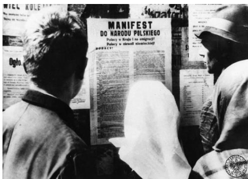
Fotografia propagandowa Polskiego Komitetu Wyzwolenia Narodowego promująca jego pierwsze działania: wydanie Manifestu Lipcowego i przeprowadzenie reformy rolnej.

Dziennikarzy próbujących obiektywnie przedstawić rzeczywistość natychmiast usuwano, nierzadko fizycznie. Skala tej wojny była wszechogarniająca, absolutnie totalna. Trzeba pamiętać, że ogromny, choć nieoficjalny, udział w tej sowieckiej wojnie z polskim dążeniem do niepodległości mieli Sowieci instalowani w różnych służbach i urządach tworzonego w Polsce komunistycznego państwa.