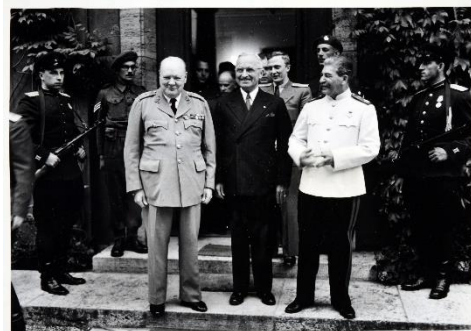
Konferencja w Jałcie - Winston Churchill, Franklin Delano Roosevelt i Józef Stalin w pałacowym patio w Liwadii.

Niestety, rola Stalina i znaczenie Związku Radzieckiego w tym przymierzu sprawiły, że dla zachodnich aliantów staliśmy się przedmiotem geopolitycznego handlu, mającego zadowolić ich „wielkiego sojusznika”. Na konferencji w Jałcie 2 zostaliśmy nawet nie sprzedani, ale porzuceni jako wojenny łup dla Stalina. Zostało to „ubrane” w szereg ustaleń mających stworzyć