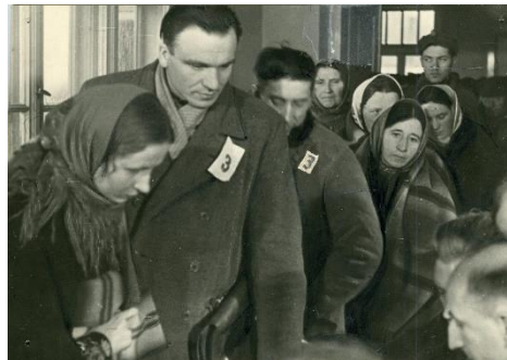
Głosowanie w sfalszowanych wyborach do Sejmu Ustawodawczego 19.01.1947 r.

Sowieckie NKWD 5 i sowiecki Kontrywiad Wojskowy Smiersz 6 (współodpowiedzialny za zbrodnię „Obławy Augustowskiej”) oraz podporządkowane im formacje zbrojne „Rządu Lubelskiego” starały się za wszelką cenę zdławić antykomunistyczne powstanie „Żołnierzy Niezłomnych”. Na polityczną opozycję spadł szereg represji. Atakowano, a nawet zabijano działaczy PSL. Przed wyborami zamordowano ponad 200 działaczy ruchu ludowego i aresztowano ponad 10 tysięcy (w tym 146 kandydatów na posłów). Aresztowano też około 50 tysięcy jawnych sympatyków PSL. Seryjnie wytaczano polityczne procesy. Napadano na partyjne lokale i bezwzględnie niszczone ich potencjał publicznej informacji. Komuniści posunęli się nawet do unieważnienia w 10 okręgach list wyborczych PSL. Większość okręgowych komisji wyborczych została obsadzona wyłącznie przez reżimowe służby. Prawie połowa z nich była agentami UB. Wszędzie tam, gdzie w komisjach nie było mężów zaufania z PSL, komuniści totalnie fałszowali wyniki, tworząc nowe „protokoły”.