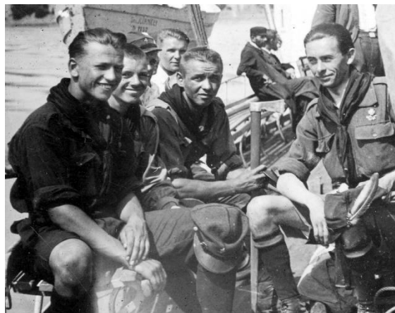
13 Wileńska Drużyna Harcerska im. Zawiszy Czarnego na obozie wędrownym (1927 r.). Drużyna na statku wiślany w drodze do Kazimierza.