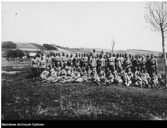
Korpus oficerski 100. Cieszyńskiego Pułku Piechoty przed bitwą pod Gorlicami, 29.04.2915 r. - fotografia grupowa.