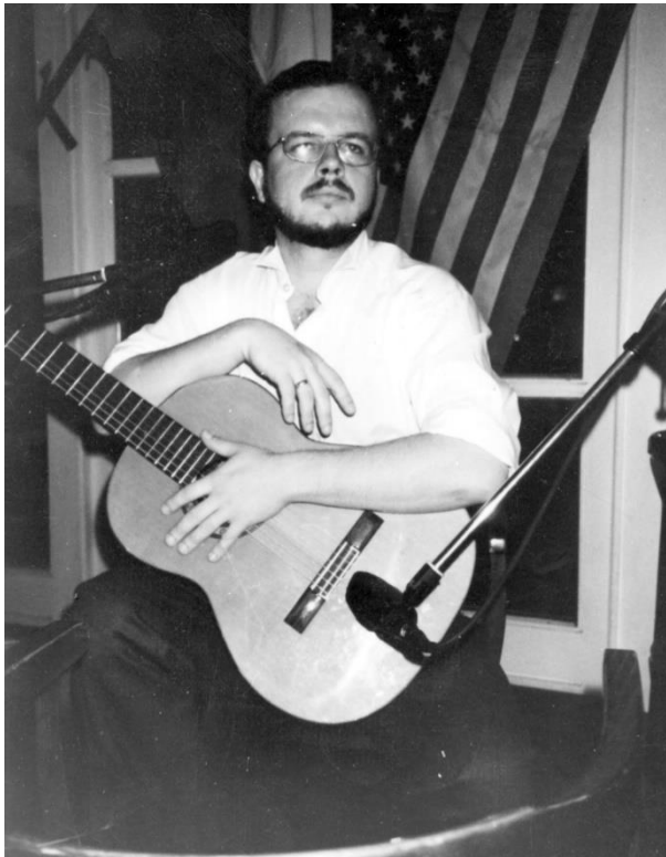
Jacek Kaczmarski.

Symbolem podziału Europy przez porządek jałtański była początkowo „żelazna kurtyna” z przemówienia Winstona Churchilla 3 . Od 1961 roku znakiem rozdarcia kontynentu stał się Mur Berliński 4 . Jego geneza wiązała się z masowymi migracjami mieszkańców wschodnich Niemiec (Niemieckiej Republiki Demokratycznej) do Niemiec zachodnich (Niemieckiej Republiki Federalnej). Ucieczki zaczęły się w 1949 roku. Trzy lata później przybrały taką skalę, że komuniści wzmocnili osłonę międzyniemieckiej granicy i jedyną „bramą na Zachód” pozostały wewnętrzne granice między obiema częściami Berlina. Niewiele to dało i do roku 1961 NRD opuściło około 2,6 miliona jego mieszkańców, często młodych i wykształconych. Dla kraju o