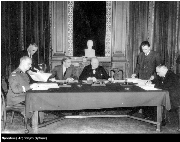
Podpisanie układu polsko-radzieckiego o nawiązaniu stosunków dyplomatycznych w Londynie (30 lipca 1941 r.)

uwagę, że w serialu praktycznie nie istnieje temat sowieckiej i niemieckiej okupacji wschodnich województw Rzeczypospolitej.