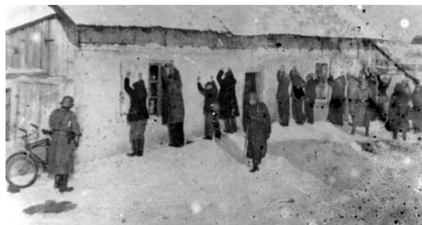
Egzekucja Polaków w Wawrze.

Na główną organizację polskiego oporu przeciwko niemieckiej okupacji serial kreuje Polską Partię Robotniczą 1 , a na główną siłę zbrojną tej walki Gwardię Ludową 2 , która jako jedyna realnie sprzeciwia się Niemcom. Niestety, w świetle współczesnych badań możemy określić to jako absolutne kłamstwo. Wbrew powojennej propagandzie na terytoriach okupowanych przez Niemców komuniści i ich oddziały zbrojne aż do pierwszej połowy 1944 roku stanowiły margines działającego w Polsce ruchu oporu. Poza tym był to ruch otwarcie kolaborujący z Sowietami i zwalczający partyzantkę uznającą Rząd RP na Uchodźstwie 3 . Główną siłą polskiej walki z Niemcami były organizacje i formacje związane z dwoma nurtami – które nieco uogólniając nazwiemy „akowskim” i „narodowym” – oraz z ruchem ludowym. Zostały one całkowicie zdyskredytowane lub pominięte w „Polskich drogach”. Warto też zwrócić