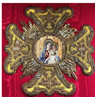
Krzyż Konfederacji Barskiej.

Konfederacja Barska (1768-1772) 3 uważana jest wspólnie za pierwsze i najdłuższe z polskich powstań narodowych. Była związkiem szlachty przeciwko otwartej, bezwzględnej ingerencji (w tym zbrojnej) Rosji w polityczny i ustrojowy porządek Rzeczypospolitej. Głównymi celami była obrona niepodległości i wiary katolickiej oraz zniesienie ustaw narzuconych przez Rosję, zwłaszcza dotyczących równouprawnienia innowierców. W przypadku tych ostatnich sprzeciw budziła brutalna presja na Sejm, posuwająca się nawet do porwania posłów.