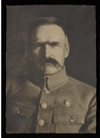
Fotografia – portret Józefa Piłsudskiego (1914-1918).

We współczesnej wersji pieśń ma 9 zwrotek oraz powtarzany refren. Pierwsza zwrotka i refren przedstawiają legionistów jako butnych straceńców, ruszających do beznadziejnej walki z potężnym wrogiem i ofiarujących swoje życia Ojczyźnie.