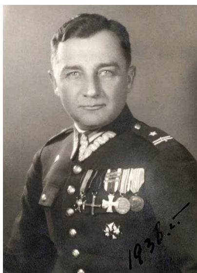
Portret mjr Henryka Dobrzańskiego „Hubal” nieznanego autorstwa (1936).

Henryk Dobrzański herbu Leliwa urodził się w 22 czerwca 1897 roku w Jaśle. Pochodził ze szlacheckiej rodziny o arystokratycznych koneksjach – związanej m.in. z Lubienieckimi herbu Rola i Potockimi herbu Pilawa. Według części historyków Henryk Dobrzański był, zarówno ze strony ojca i matki, potomkiem w linii prostej sławnego polskiego rycerza z przełomu XIV i XV wieku – Zawiszy Czarnego z Garbowa herbu Sulima 3 . W grudniu 1914 roku Henryk został przyjęty na stacji zbornej w Krakowie do Legionów Polskich. Od maja 1915 służył w plutonie kawalerii sztabowej przy Komendzie Legionów Polskich. W grudniu tego roku został na własną prośbę przeniesiony do 2. Pułku Ułanów. W lipcu 1917 roku pułk ten złożył przysięgę na wierność cesarzowi Niemiec i wszedł w skład Polskiego Korpusu Posiłkowego. Po podpisaniu Traktatu Brzeskiego 4 (1918) w lutym 1918 roku część tego korpusu pod dowództwem pułkownika