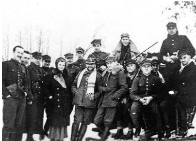
„Hubal” ze swoimi żołnierzami (zima 1940 r.).

Otrzymał od niego środki finansowe oraz rozkaz gromadzenia kadry, broni i unikania – na razie – walki z Niemcami 1 .