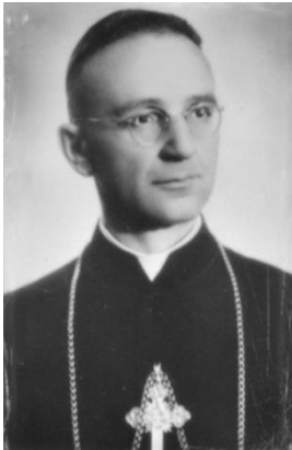
Henryk Strąkowski (1910–1965) polski biskup rzymskokatolicki. Zdjęcie nieznanego autorstwa z jego nagrobka.

Dokładna liczebność oddziałów Narodowych Sił Zbrojnych nie jest znana, współcześnie zakłada się, że było to maksymalnie 75 tysięcy ludzi (choć niektóre opracowania podają nawet 100 tysięcy), a po akcji scaleniowej z Armią Krajową w marcu 1944 roku było nie więcej niż 65 tysięcy.