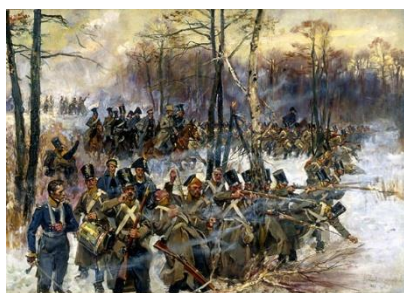
Bitwa pod Grochowem, stoczona 25. lutego 1831 roku, była największą bitwą powstania listopadowego. Malował: Wojciech Kossak (1928).

Powstanie Listopadowe było zbrojnym sprzeciwem wobec rosyjskich działań ograniczających autonomię Królestwa Polskiego. To niewielkie państwo zostało utworzone decyzją Kongresu Wiedeńskiego (1814-15) 3 , na mocy porozumienia z 3 maja 1815 roku, w którym mocarstwa dokonały podziału Księstwa Warszawskiego. Utworzone w ten sposób Królestwo Polskie 4 zostało połączone unią personalną z Imperium Rosyjskim. Posiadało własną Konstytucję, będącą kompilacją Konstytucji Księstwa Warszawskiego oraz Konstytucji 3 Maja i dość liberalną jak na swój czas. Miało własny Sejm, monetę, wojsko, sądownictwo i szkolnictwo (łącznie z wyższym). Z kompetencji rządu Królestwa wyłączona była tylko polityka zagraniczna. Car Aleksander zobowiązał się również włączyć w przyszłości do Królestwa Polskie ziemie za Bugiem i Niemnem, pozostające pod rosyjskim zaborem. Wydawało się to potwierdzać utworzenie Korpusu Litewskiego, który miał mundury takie same jak armia Królestwa (poza odznakami) i polską komendę.