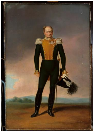
Portret cara Aleksandra I. Obraz nieznanego malarza (XIX w.).

Rosja zaczęła bardzo szybko łamać ustalone zasady i ograniczać polską autonomię. Już w 1819 roku car Aleksander I jako król Polski zniósł wolność prasy i wprowadził cenzurę prewencyjną. W 1821 roku zniesiono wolność zgromadzeń i zakazano działalności masonerii. Doprowadziło to do aktywizacji konspiracji niepodległościowych i represji. Rok później królewska Policja namierzyła i rozbiła spisek związany z Narodowym Towarzystwem Patriotycznym Waleriana Łukasińskiego. Jego proces i skazanie w 1824 roku odbiło się szerokim echem w społeczeństwie Królestwa. W 1825 roku zniesiona została jawność obrad Sejmu. Dwa lata później rozbite zostało Towarzystwo Patriotyczne 1 . Łagodne wyroki wydane na jego członków przez Sąd sejmowy potwierdziły w opinii publicznej, że spiskowcy działali w dobrej wierze broniąc łamanej Konstytucji z 1815 roku 2 . Dla społeczeństwa był to dobitny sygnał, że nadzieje związane z nowym carem i królem Mikołajem I były tylko złudzeniem. Na fali tych nastrojów w 1828 roku powstało niepodległościowe sprzysiężenie w warszawskiej Szkole Podchorążych Piechoty.