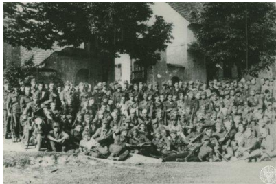
Grupa żołnierzy Brygady Świętokrzyskiej NSZ przed budynkiem w nieznanym miejscu podczas marszu przez Czechosłowację [?], 5 V 1945 – 30 VI 1945 r.