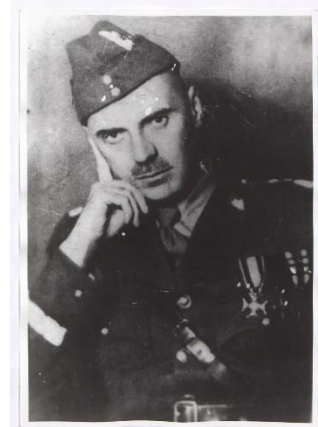
Fotografia gen. Władysława Andersa (fotokopia zdjęcia z 1939 roku).

21 kwietnia doszła informacja o planowanym przez Niemców ataku na Brygadę. 5 maja Polacy zaatakowali i po krótkiej walce zdobyli niemiecki obóz koncentracyjny dla kobiet w Holiszowie 1 . Uwolniono około 700 więźniarek (w tym 167 Polek) i wzięto do niewoli około 200 SS-manów. 7 maja