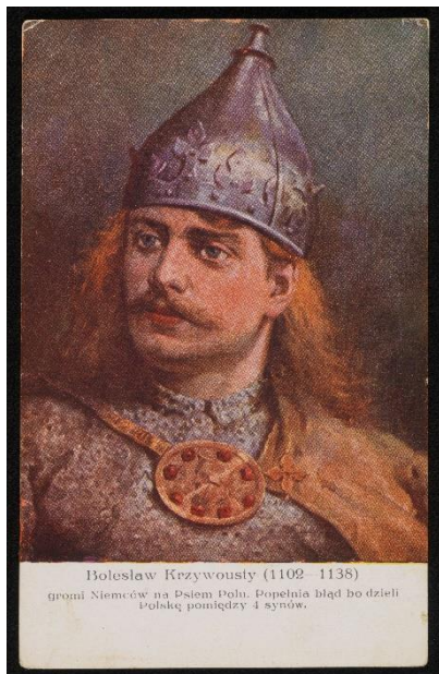
Bolesław Krzywousty (1102-1138) gromi Niemców na Dzielu Polu. Popelnia błąd bo dzielił Polskę pomiędzy 4 synów.

Bolesław Krzywousty na pocztówce z 1938 r. Matejko, Jan (1838-1893). Źródło: Polona