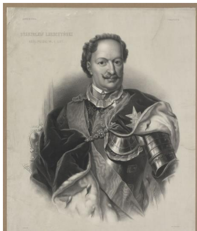
Stanisław Leszczyński – król Polski i wielki książę litewski (1733).

Konflikt był skutkiem podpisanego w 1732 roku Traktatu Loewenwolda, będącego austriacko – prusko – rosyjską zmową przeciwko Rzeczypospolitej w celu narzucenia jej wygodnego dla siebie króla. Rok później na warszawskiej elekcji szlachta wybrała jednak swojego kandydata – Stanisława Leszczyńskiego. Konfederacja Dzikowska została zawiązana dla jego obrony przed sasko – rosyjską interwencją. Oddziały konfederatów dowodzone przez regimentarza Józefa Potockiego próbowały uderzyć przez Wielkopolskę na Saksonię, ale zostały rozbite w kilku bitwach. Do 1736 roku konfederaci walczyli jeszcze na Podolu i w Puszczy Zielonej.