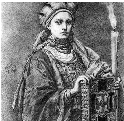
Dobrawa (cz. Doubravka) (ur. ok. 930, zm. 977) – księżniczka czeska z dynastii Przemyślidów, księżna polska, żona Mieszka I.

Dobrawa (wedle późniejszych) zapisów Dąbrówka, Dobrochna lub Dobrawca była czeską księżniczką z rodu Przemyślidów, córką księcia Czech Bolesława I Srogiego. Nie wiemy dokładnie kiedy się urodziła. Wedle Kroniki Praskiej Kosmasa, wychodząc za mąż w 966 roku za polskiego władcę księcia Mieszka I była kobietą podeszłego wieku . Część współczesnych badaczy uważa, że był to zapis tendencyjny, a nawet złośliwy. Obecnie przyjmuje się, że Dobrawa przyjeżdżając do Polski miała około 20-25 lat.