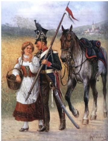
Ułan kompanii centralnej. Obraz Jan Chełmiński (1913)

Tekst jest śpiewem dziewczyny do swojego ukochanego, który jest żołnierzem i wkrótce wyruszy na wojnę. Wspomnienie o „chorągiewce”, którą szyje dziewczyna z jednej strony wskazuje na to, że żołnierz ów jest ułanem (formacja ta nosiła biało-czerwone chorągiewki na lancach), z drugiej pozwala przyjąć, że tekst powstał w latach 1807- 08. Później biało-czerwone chorągiewki pozostały w pułku ułanów nadwiślańskich oraz w formacjach szwoleżerów, lansjerów i eklererów Gwardii Cesarskiej. W pułkach ułanów zamieniono je na trójbarwne. Ułani, jako zorganizowana formacja, pojawili się w wojsku Rzeczypospolitej w pierwszej połowie XVIII wieku. Wywodzili się z lekkiej jazdy tatarskiej i początkowo to przede wszystkim litewscy Tatarzy 1 tworzyli pułki ułanów 2 . Najpierw byli tylko lekką jazdą, przeznaczoną do działań rozpoznawczych i osłonowych. Z czasem zaczęli dosiadać coraz większych koni i stali się uniwersalną jazdą