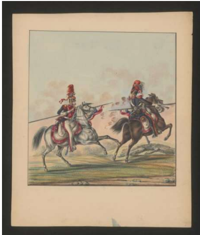
Jazda dwunastego i piętnastego pułku ułanów.

średnią, doskonale sprawdzającą się zarówno walce podjazdowej, jak i w szarżach łamiących zwarte szyki przeciwnika. Ułani walczyli w wojnie 1792 roku oraz w Powstaniu Kościuszkowskim. Symbolem ich bitności może być to, że kiedy w 1794 roku upadała atakowana przez rosyjskie oddziały warszawska Praga, jej wałów do końca broniły właśnie pułki litewskich ułanów 1 .