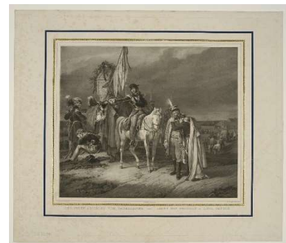
Polaków pożegnanie z Ojczyzną (Der Polen Abschied vom Vaterlande), lata 30-te XIX w. Litografia: F. Hohe.

miało fatalne skutki zwłaszcza dla Wołynia i Żmudzi). Tysiące patriotów musiało uciekać za