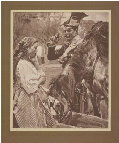
Ułan z fajką pojący konia, fotografia obrazu w. Kossaka z 1911 r. Mundur ułana z czasu Królestwa Kongresowego i Powstania Listopadowego.

różnych okazjach wręcz sabotowali sprawę walki o niepodległość.