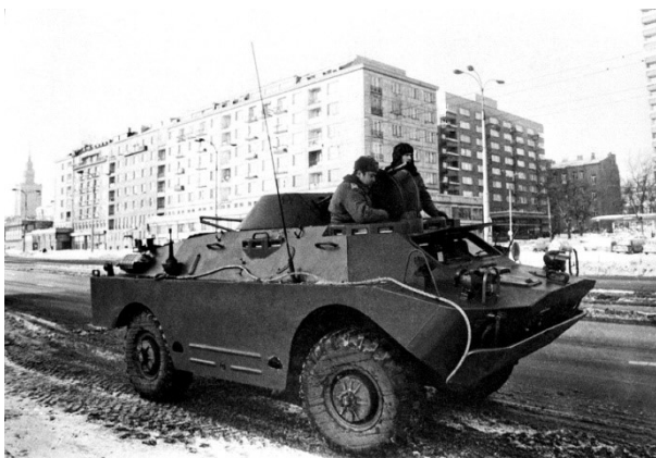
Stan Wojenny 1981-83. Samochód pancerny BRDM na jednej z ulic Warszawy

telefoniczne. Ministerstwo Obrony Narodowej powołało pod broń kilkadziesiąt tysięcy rezerwistów, zmilitaryzowano większość centralnych resortów i instytucji, część strategicznych sektorów gospodarki oraz 129 najważniejszych fabryk. Ponadto zakazano strajków, zgromadzeń, działalności społecznej i związkowej oraz wyłączono telefony i wprowadzono cenzurę korespondencji. Od godziny 19.00 do 6.00 obowiązywała godzina milicyjna.