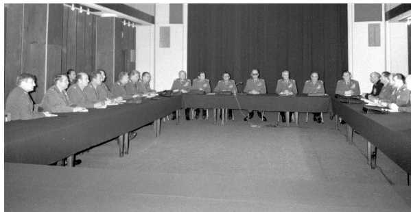
Posiedzenie Wojskowej Rady Ocalenia Narodowego pod przewodnictwem gen. Wojciecha Jaruzelskiego; Warszawa, 14.12.1981

„Resorty siłowe” rozpoczęły swoje działania 12 grudnia 1981 roku po godzinie 0:00. W wyniku Akcji „Jodła” aresztowano tysiące opozycjonistów, w tym prawie całe władze „Solidarności”. Zajęto również wszystkie obiekty teletransmisyjne i centrale