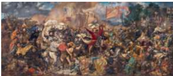
Bitwa pod Grunwaldem – obraz olejny Jana Matejki namalowany w latach 1875–1878.

roku, zachowany w kościele w Tumie pod Łęczycą, uważany za hipotetyczną inspirację dla autora „Bogurodzicy”. Melodię zapożyczono wprost ze znanej na Zachodzie, a spisanej i przyniesionej do Polski przez Benedyktynów, miłosnej pieśni rycerskiej. Do „Bogurodzicy” często odwoływali się również współcześni twórcy – m.in. Andrzej Panufnik, Wojciech Kilar oraz Krzysztof Meyer. W jednej ze scen filmu „Pierścienie z orłem w koronie” przypomniał ją jako „pieśń rycerstwa polskiego” Andrzej Wajda. Odśpiewanie „Bogurodzicy” przed bitwą pod Grunwaldem przedstawił Aleksander Ford w filmie „Krzyżacy”.