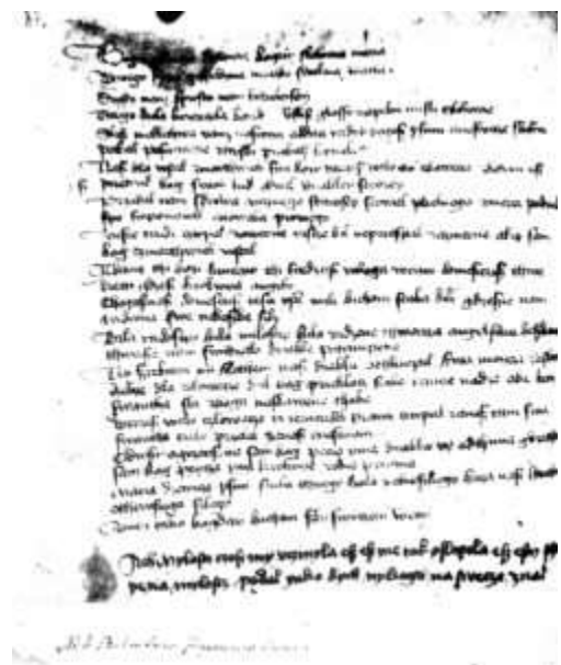
Rękopis Bogurodzicy z 1408 roku przechowywany w Bibliotece Jagiellońskiej w Krakowie.

Najpóźniej w połowie XIV wieku „Bogurodzica” stała się pieśnią rycerską i de facto hymnem państwowym, śpiewanym przed ważnymi bitwami. Pierwsza wzmianka o tym pochodzi z przekazu Długosza o bitwie pod Grunwaldem: „Kiedy zaczęły rozbrzmiewać pobudki, całe wojsko królewskie zaśpiewało donośnym głosem ojczystą pieśń: „Bogurodzicę”, a potem wznosząc kopie rzuciło się do walki”. Określenie „Bogurodzicy” mianem „ojczystej (narodowej) pieśni” (w domyśle – z długą tradycją), wskazuje, że musiała ona upowszechnić się w stanie rycerskim co najmniej od kilku pokoleń.